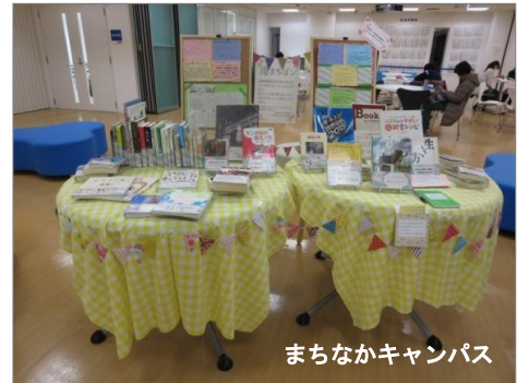
まちなかキャンパス