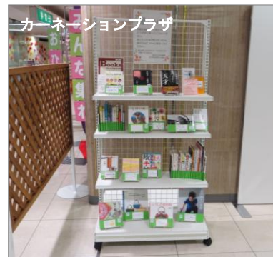
カーネーションプラザ