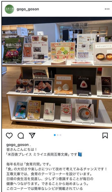
▲6月22日投稿 健康増進課とのコラボ食育展示