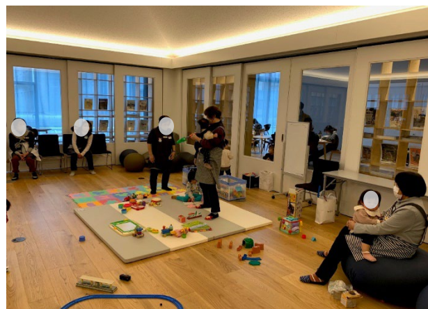
▲保育サービスを館内で行う