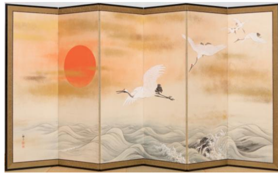
竹内蘆風「旭日に鶴」(部分)