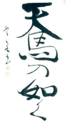
堀愛泉「天馬の如く」