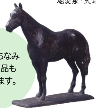
池上璉「セイカバートン号」