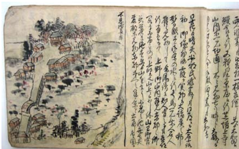
▲江戸・上野の不忍池が描かれたページ

読む程に味わい深く、読み手の数だけ楽しみ方がある旅日記。さて、どんな旅にでかけますか？