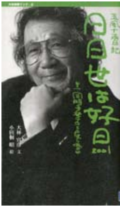
『日々世は好日2001』 大林 宣彦／文 たちばな出版