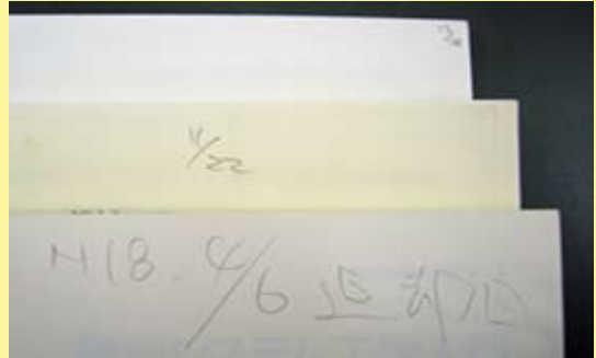
表紙をめくると、そこには自分が借りた日や、返却日が書かれたメモ書きが…

図書館資料は、長岡市民1人1人の大切な財産です。大勢の市民が長く利用できるよう、大切に扱いましょう！