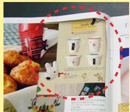
ページの一部が切り取られている。