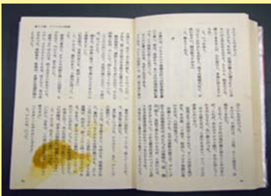
飲み物をこぼした痕跡が見られる。