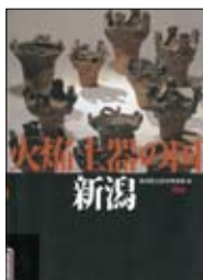
『火焰土器の国新潟』 新潟県立歴史博物館／編 新潟日報事業社

査・研究の成果をわかりやすく解説。細かな造形の石槍や、最古級とは思えないほど繊細な文様を持つ土器、多数の動物骨などからは、1万年以上昔を生きただけの人々の生活が見えてきます。（五十嵐一樹）