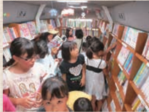
▲本を借りる児童で賑わう米百俵号車内。

その他、依頼に応じて小学校や保育園で読み聞かせを行っており、「楽しみにしています」という声を頂いています。