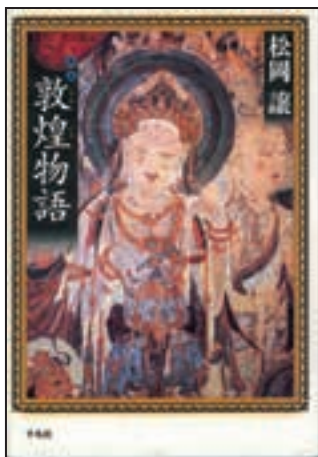
『敦煌物語 新版』 松岡 譲／著 平凡社

『敦煌物語』の初版は昭和18年に発行されています。その初版に大幅に加筆した昭和36年版、そしてさらに改行やルビを加え地名等を改めて平成15年に発行されたのが、今回紹介する小説です。