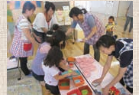
▲世界で1冊だけの本を親子で作るイベント「絵本のたね」