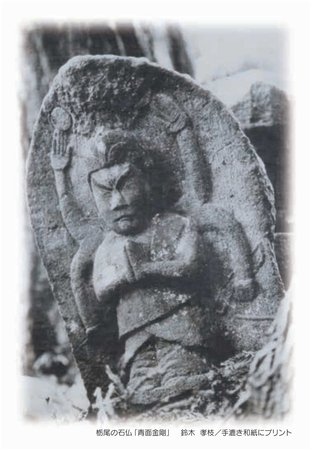
栃尾の石仏「青面金剛」 鈴木 孝枝／手漉き和紙にプリント