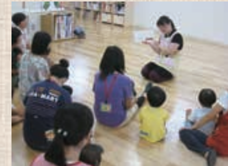
▲毎日行われているイベント「おはなしでてこい」