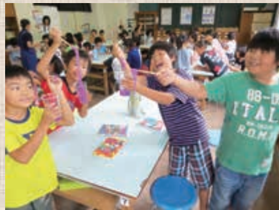
▲科学実験で大人気のスライム作り。