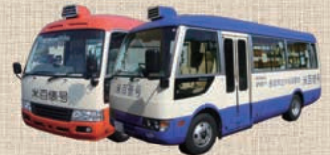
▲館外活動に使用する移動図書館。

保育園・小中学校・子育てサークル等からの依頼に応じて、読み聞かせやブックトーク、絵本講座を行います。子育てサークルではお母さんが赤ちゃんを膝に乗せて手遊びをしたり、和やかな雰囲気の中でおはなし会を行っています。小学校では、職員による本の紹介に、子どもたちは目を輝かせて聞き入っています。いずれも、子どもたちと本を結ぶ、図書館の重要な業務と考えています。おはなし会をご希望の際には、市内各図書館までお問い合わせください。