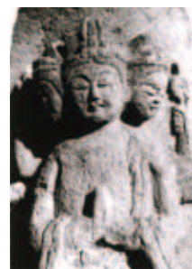
栃尾の石仏「馬頭観音」

新潟在住で栃尾の石仏をはじめ、県内の風景を撮り続ける鈴木孝枝の作品約150点を紹介します。