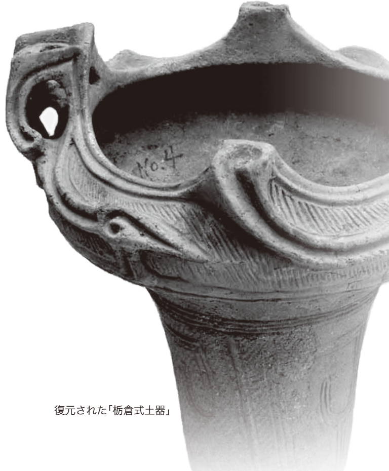
復元された「栃倉式土器」