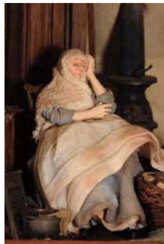
フォーティ・ウインクス(部分)

本展を通じて、ドールハウスの「見る」「学ぶ」「遊ぶ」「作る」「集める」「旅をする」といった6つの楽しみ方をご紹介しますとともに、ミニチュア作品の技術の精巧さ、作られた社会背景、奥深さなど、その魅力を余すことなくご紹介します。