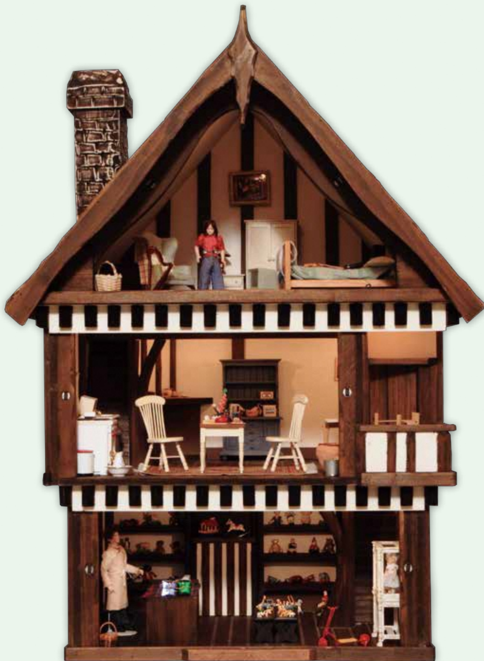
チューダー様式の玩具屋 1996年 イギリス