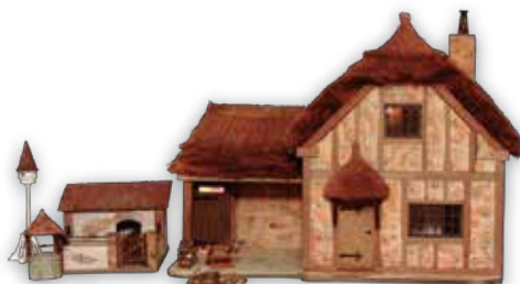
コーンウォールの農家 2012年 イギリス