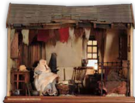
フォーティ・ウインクス 1996年 イギリス