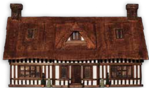
チューダー朝酒場 1996年 イギリス