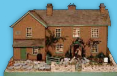
ビアトリクス・ポターのヒルトップ・ハウス 1999年 イギリス

後援 新潟日报社、読売新聞新潟支局、朝日新聞新潟総局、毎日新聞新潟支局、長岡新聞社、栃尾タイムス社 NHK新潟放送局、BSN新潟放送、N S T、TeNYテレビ新潟、UX新潟テレビ21、NCT エフエムラジオ新潟、FM PORT 79.0、FMながおか80.7