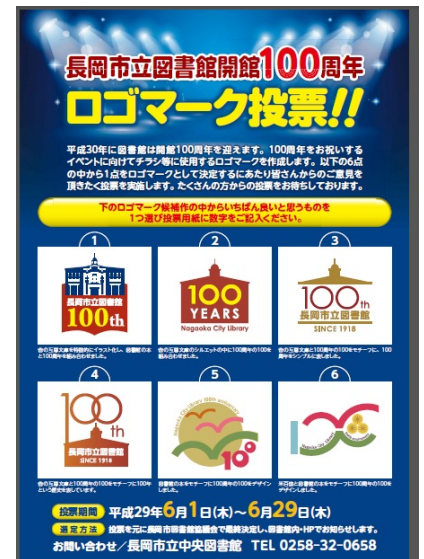
【ロゴマーク投票ポスター】