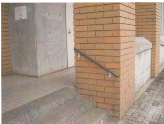
【手摺の設置（中央図書館 正面玄関）】