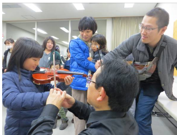
【大好評だった楽器体験の様子】