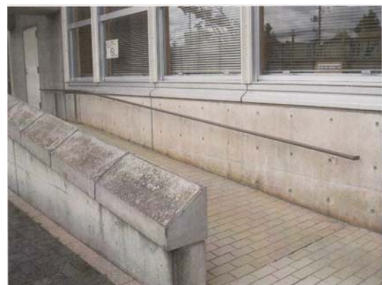
【手摺の設置（中央図書館 スロープ）】