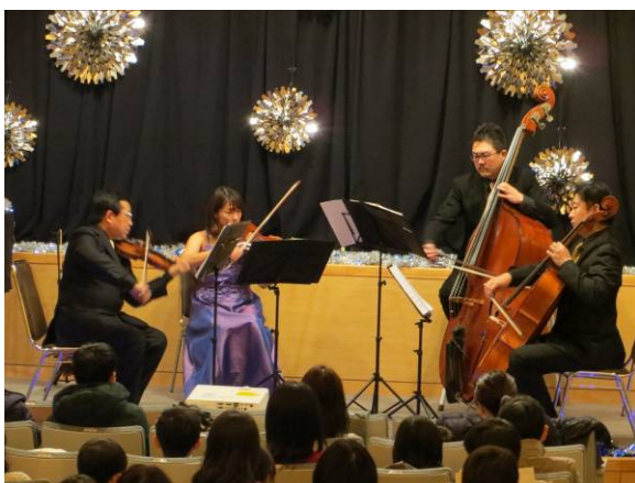
【プロの演奏家による本格的な演奏】