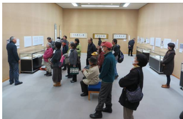
【詩人堀口大學と長岡 展示解説の様子】