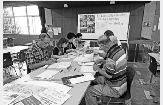
● 長岡市資料整理ボランティアによる東日本大震災避難所資料の整理作業(平成27年9月撮影)