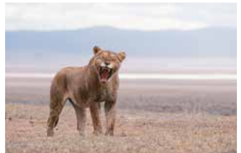
ンゴロンゴロ自然保護区 タンザニア