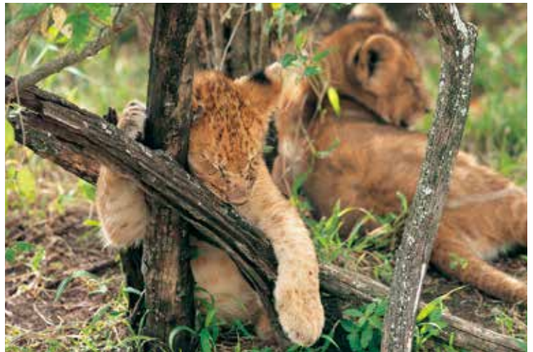
マサイマラ国立保護区 ケニア

世界を舞台に活躍する動物写真家・岩合光昭氏。地球上のあらゆる地域をフィールドに大自然と野生動物を撮り続ける一方、私たちの身近に暮らすイヌやネコの撮影も継続し、多くの人々を魅了しています。岩合氏の取材対象の中でも、とりわけ多くの時間を割いて撮影を続けているのがネコとライオンです。岩合氏はこう話します。「ネコは小さなライオンだ。ライオンは大きなネコだ。」私たち人間の生活に溶け込むように暮らすネコ。一方で百獣の王と呼ばれ、人間と無縁のように野生の世界に生きるライオン。彼らは同じネコ科でありながら、大きさも、生活も異なります。それでも、やはりどこか似ているのです。