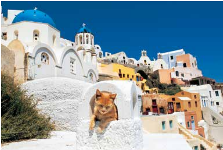
サントリーニ島 ギリシャ