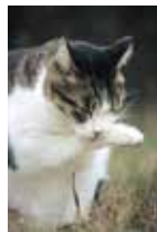
ネコ：倉吉市 島根県