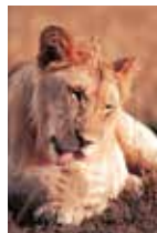
ライオン：ンゴロンゴロ自然保護区 タンザニア