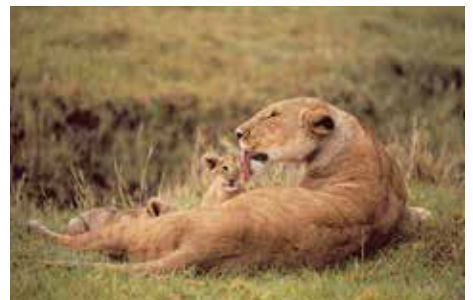
ンゴロンゴロ自然保護区 タンザニア

■ 岩合光昭ギャラリートーク 7月24日(日) ①11:00～ ②14:00～ (申込不要・要観覧券)