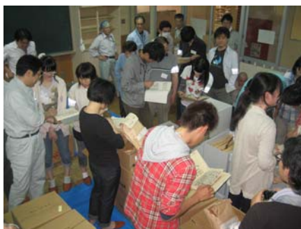
▲作業の合間にミニ講義を聞きながら坂牧家文書を閲覧

6月25日（土）・26日（日）、山古志公民館種苧原分館（旧種苧原小学校）にて、中越大震災で被災し、昨年9月に返還した文書資料の整理作業を行いました。新潟歴史資料救済ネットワーク（新潟大学教官・学生、高校教員、博物館・文書館職員など）や長岡市資料整理ボランティアの皆さんなど、のべ74人が参加して旧役場の文書を中心に整理。被災資料の「現地保存」「現地活用」に向け、着実に活動を重ねました。（田中洋史）