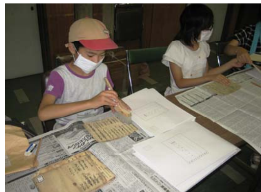
▲郷土史交流室で作業を体験 ~慎重にホコリを払います

文書資料室の利用の仕方を学んだり、歴史資料の整理・保存作業を体験したりと、盛りだくさんの内容でした。熱心にメモをとりながら話を聞く姿も見られました。これをきっかけに、歴史に興味をもつ子どもたちが増え、気軽に文書資料室を利用してもらえればうれしいです。 (桜井奈穂子)