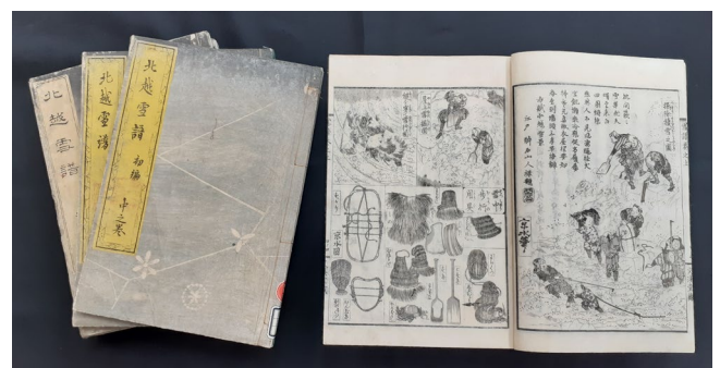
『北越雪譜』初編(3冊) 二編(4冊) 後刷り

江戸時代に地方の作者が本を出版するのは並大抵ではありません。牧之は、かの滝沢馬琴や山東京伝らの戯作者と、長期に及ぶ交渉の過程で草稿を何度も書き直し、紆余曲折を経てようやく京伝の弟である京山とその子京水の協力により出版にこぎつけます。実に40年来の苦勞が実を結びました。