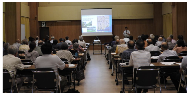
▲7月1日の開館記念講演会(第1回れきぶん講演会)

歴史文書館では、11月7日(火)から12月2日(土)まで、初の企画展『長岡市史』回顧展Ⅰ 検地帳に中世を読むー地名に刻まれた村の歴史ーを開催します。様々な機会をとらえて、歴史文書館にご来館いただければ幸いです。(田中洋史)